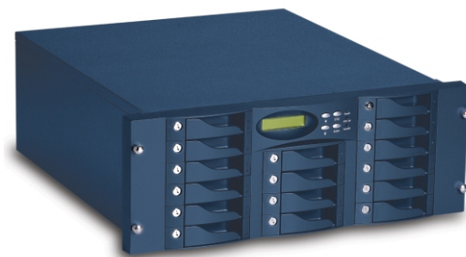
NNAS Rack Mount